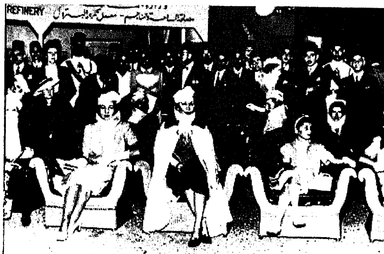
الملكة نازلي وثلاث أميرات بعد زواج ابنتها الأميرة فوزية .